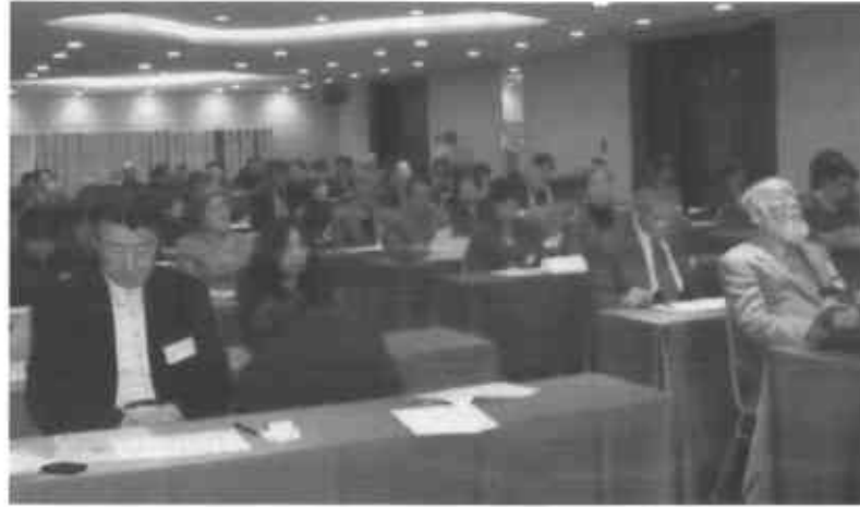
忘年句集祭 会場風景 (背景に墨書の句を掲げた)

関西現代俳句協会には恒例となる名物的催しとして、三十五年目を数える「忘年・句集祭」がある。今年会場はラマダホテル大阪の都合で、十一月二十四日(日)に開催したが、参加は約百名の方々に、例年にとらぬ盛り上がりを見せた。ご承知のようにこの祭はその前年の句集祭以降に出版された会員の作品、句集、エッセイ、評論などを持ち寄って展示している。句集の場合は作者自選の一句を墨書して会場の一面に張り出すのであるが、それに作者の挨拶の機会もあって、これから自分も句集出版したいと言う方々からは参考になると喜ばれている。何しろ