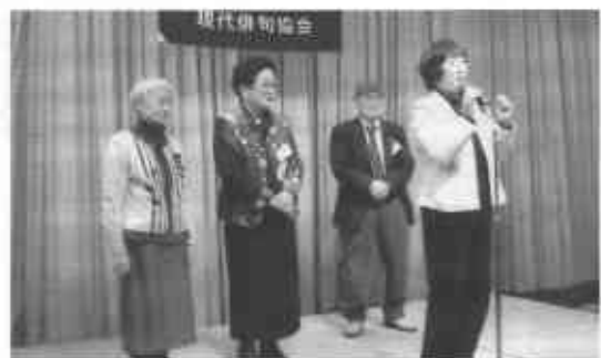
忘年句集祭 会員紹介の「鴻の鳥」の皆さん

七六句の投句と言う予想を超えた結果が見られた。これは誠に喜ばしいことで、今後とも参加されることをお願いし、これからもさらに回を重ねて行きたい。なお、関係者、参加者には大会終了後「作品集」をお配りしたが、次は第三回の募集に入る予定である。(大会の結果は本号の1頁からの記事をご覧ください)